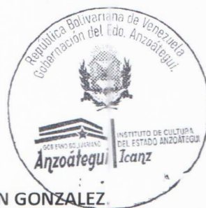
LCDO. JESUS ENRIQUE FERMIN GONZALEZ.

PRESIDENTE DEL INSTITUTO DE CULTURA DEL ESTADO ANZOÁTEGUI (ICANZ), designado mediante Decreto N° 19, publicado en la Gaceta Oficial del Estado Anzoátegui, Edición Ordinaria N° 05, de fecha 24 de Enero de 2023. Emanada de la Gobernación del Estado Anzoátegui