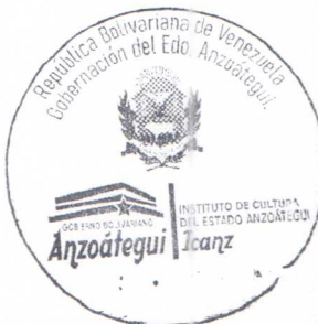
LCDO. JESUS ENRIQUE FERMIN GONZALEZ.

PRESIDENTE DEL INSTITUTO DE CULTURA DEL ESTADO ANZOÁTEGUI (ICANZ), designado mediante Decreto N° 19, publicado en la Gaceta Oficial del Estado Anzoátegui, Edición Ordinaria N° 05, de fecha 24 de Enero de 2023. Emanada de la Gobernación del Estado Anzoátegui