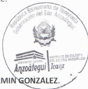
LCDO. JESUS ENRIQUE FERMIN GONZALEZ.

PRESIDENTE DEL INSTITUTO DE CULTURA DEL ESTADO ANZOÁTEGUI (ICANZ), designado mediante Decreto N° 19, publicado en la Gaceta Oficial del Estado Anzoátegui, Edición Ordinaria N° 05, de fecha 24 de Enero de 2023. Emanada de la Gobernación del Estado Anzoátegui